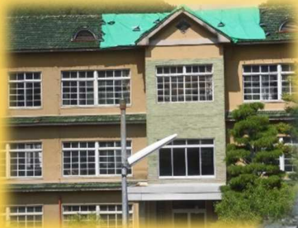
屋根瓦を葺き替える