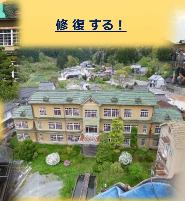
シンボリック建物