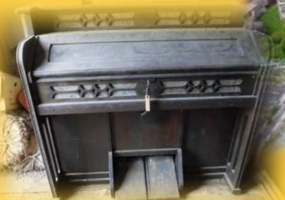
ヤマハのオルガンを再度奏でる